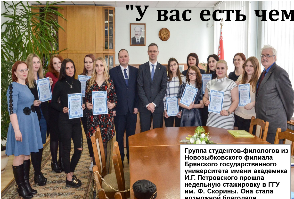
Группа студентов-филологов из Новозыбковского филиала Брянского государственного университета имени академика И.Г. Петровского прошла недельную стажировку в ГГУ им. Ф. Скорины. Она стала возможной благодаря сотрудничеству гомельского и брянского вузов.

Неделя пребывания в Гомеле надолго запомнится российским студентам. Наш вуз впечатлил их не только комфортной атмосферой, но и своими масштабами, материально-технической базой, чистотой и уютom. Учиться, узнавать новое по истории и теории русской литературы и мировой культуры, славянской мифологии и гендерной лингвистике стажерам помогли преподаватели филологического факультета. Лекции перемежывались с практическими занятиями, а новые знания – с новыми впечатлениями.