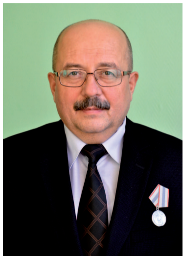
Медалью "За трудовые заслуги" награждены про-

В начале декабря в Минске Премьер-министр Беларуси Андрей Кобяков вручил государственные награды представителям трудовых коллективов.