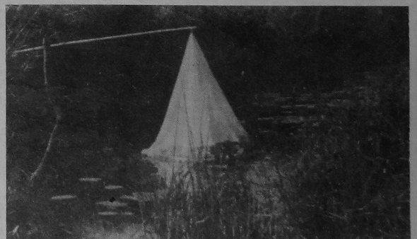
НА ЗДЫМКУ: сканструйваная студэнтамі біафона пастка-конус у працэсе выкарыстання.

В. ВЕРАМЕЕУ, асістэнт кафедры заалогіі і аховы прыроды.