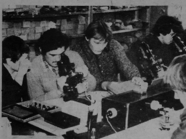
Пранікненне ў свет неспазнаванага. На здымку: на практычных занятках студэнты геалагічнага факультэта.

Т. ЛУЧАНСКАЯ, студэнтка 4-га курса гісторыка-філалагічнага факультэта.