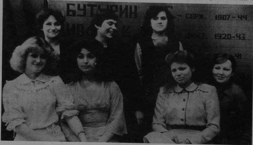
НА ЗДЫМКУ: удзельніцы самадзейнага студэнцкага тэатра «І т. п.»