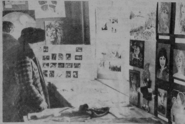
НА ЗДЫМКУ: знаёмства з экспанатамі выстаўкі.

Кіраўнікам навукова-даследчай работы студэнтаў геалагічнага і матэматычнага факультэтаў неабходна звабіць з гэтага адпаведна вывады, звярнуць асаблівую увагу на развіццё і прапаганду навукова-тэхнічнай творчасці студэнтаў і аспірантаў.