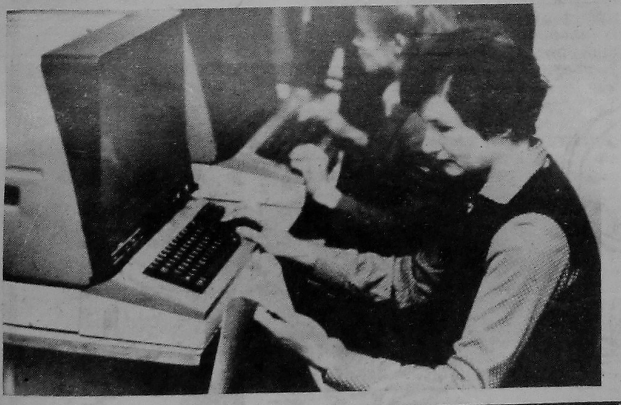
НА ЗДЫМКУ: за работай супрацоўнікі навукова-даследчай лабораторыі сістэмнага праграмавання.