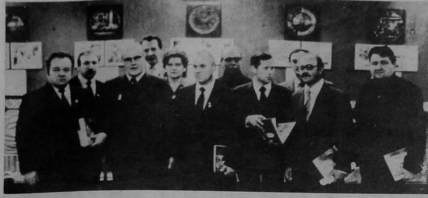
У папярэднім нумары газеты мы паведамылі аб сустрэчы пісьменнікаў трох спалорнічаючых абласцей — Бравскай, Чарнігаўскай і Гомельскай, — з якая адбылася ў нашым універсітэце і прысвячалася 60-годдзю ўтварэння