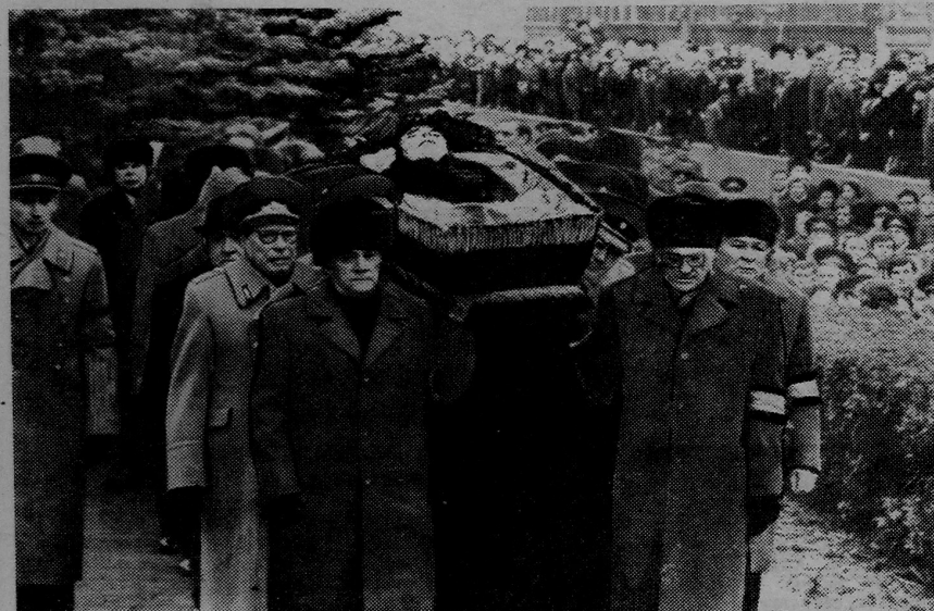
МАСКВА, 15 лістапада. Кіраўнікі Камуністычнай партыі і Савецкага ўрада нясуць труну з цэлам Леаніда Ільіча Брэжнева да Крамлёўскай сцяны.