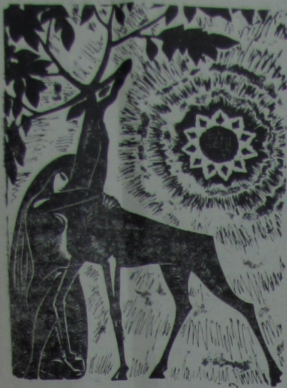
ЯНЫ ПАВІННЫ ЖЫЦЬ