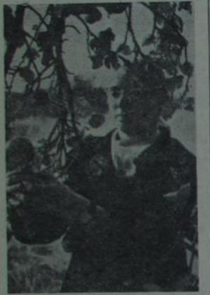
Сотні студэнтаў Гомельскага ўніверсітэта працавалі ў верасні ў калгасах і саўгасах вобласці.

...у абшырным арктычным архіпелагу — Зямлі Франца Іосіфа — налічваецца да ста астравоў. Вялікая частка іх пакрыта цэльным паніраем леднікоў, якія паволі спаўзаюць у мора.