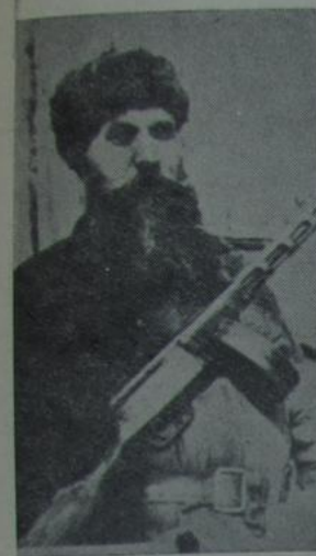
Сакратар Гомельскага падпольнага гаркома партыі, Герой Саветаў Саюза Емяільян Ігнатвіч Барышкін.

Кастрычнік 1942 г. Агублілі падпольны райком партыі правёў нараду настаўнікаў, якія прывяла паставоу адкрыць школы паўсюдна, дзе дазваляюць умовы. Да работы прыступілі настаўнікі-удзельнікі партызанскага руху. На нарадзе адзначалася, што рэгулярна працуе пачатковая школа ў вёсцы Загалле Нова-Дуброўскага сельсавета, якую ўзначальвае настаўніца - партызанка Вольга Герасімаўна Яраш.