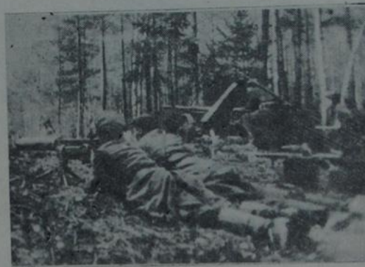
Жнівень 1941 года. Байцы Гомельскага гарадскога палка народнага апалчэння ў баі за родны горад.

6 лістапада 1941 г. У в. Скароднае Ельскага раёна адбыўся урачысты сход, прысвечаны 24-й гадавіне Вялікай Кастрычніцкай сацыялістычнай рвалюцыі. У святочна ўпрыгожаным клубе вёсел партыі ў. І. Леніна, кіраўнікоў партыі і ўрада.