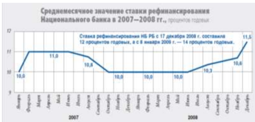
Рисунок 4 – Среднемесячное значение ставки рефинансирования Национального банка в 2007-2008 гг.

Складывающаяся экономическая и финансовая ситуация в Республике Беларусь потребовала определенной корректировки процентной политики. Учитывая более высокий уровень инфляции, чем прогнозировалось, Национальный банк с середины 2008 г. начал постепенно повышать ставку рефинансирования, доведя ее с 17 декабря 2008 г. до уровня 12% годовых, а с 8 января текущего года – до 14%. Параллельно росли ставки депозитно-кредитного рынка (рисунок 4).