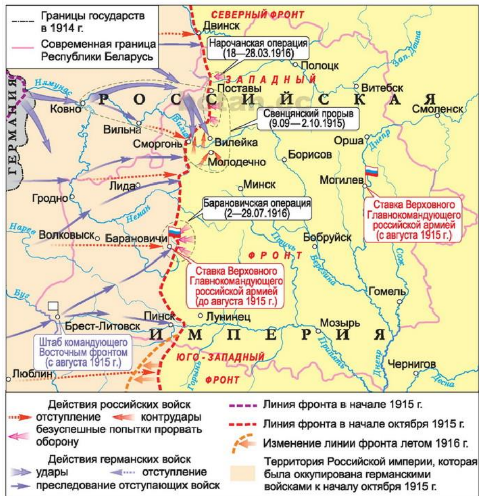
Беларусь в годы Первой мировой войны (1915—1917)

Наиболее влиятельной белорусской партией революционно-демократического направления летом – осенью 1917 г. являлась Белорусская социалистическая громада (БСГ) . БСГ поддерживала Временное правительство. Она выступала за автономию Беларуси в составе федеративной Российской республики .