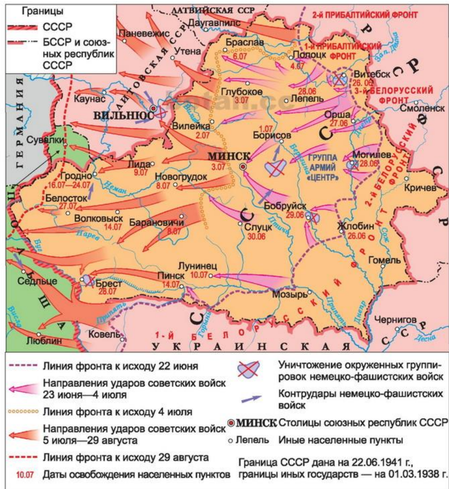
Белорусская наступательная операция «Багратион» (23 июня — 29 августа 1944 г.)