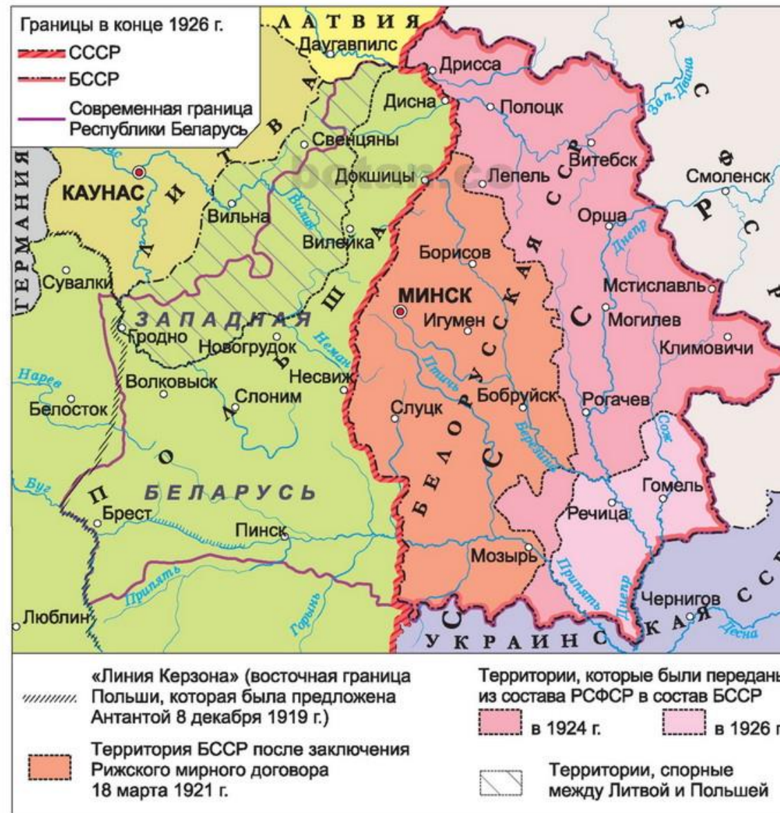
Территория Беларуси после заключения Рижского мирного договора. Укрупнение БССР в 1924 и 1926 гг.