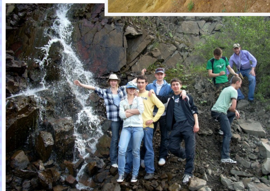
ГГУ имени Ф. Скорины. Заказ 572/2021. Тираж 50 экз.

Адрес: Беларусь г. Гомель, ул. Советская, 104 geofac@gsu.by geography.gsu.by Телефон + (375 0232) 51-01-33