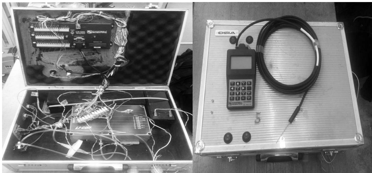
Рисунок 2. Прибор для измерения потоков \text{CO}_2

Для измерения и фиксации интенсивности фотосинтетически активной части солнечного излучения (ФАР) в конструкции предусмотрен специальный датчик. Все активные элементы питаются от трех сухозаряженных аккумуляторов.