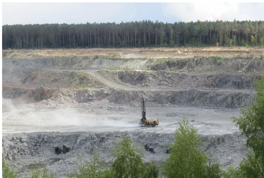
Рисунок 2 – Карьер «Крестьянская Нива»

Месторождение Глушковичи расположено на территории Украины и Беларуси, где выделяется участок Крестьянская Нива (рисунок 2). Он находится в 0,4 км к юго-западу от д. Глушковичи. Запасы по промышленным категориям составляли 8415 тыс.м 3 . Карьер «Крестьянская Нива» был открыт в 1975 году. Глубина карьера 60 м. Разработка ведется открытым способом.