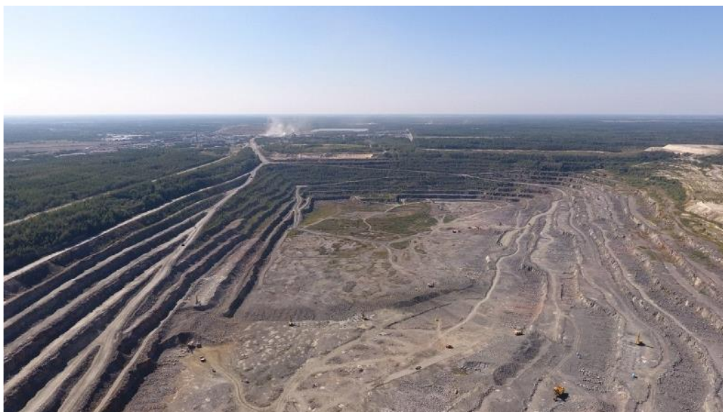
Рисунок 1 – Карьер «Микашевичи»

319706 тыс. м 3 . ПО «Гранит» обрабатывает месторождение карьерным способом, горнотехнические условия благоприятные. Проектная мощность предприятия 10,1 млн м 3 /год.