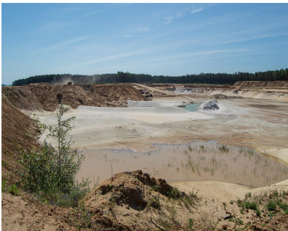
Рисунок 1 – Карьер «Лениндар»

Северо-западный и Юго-восточный (рисунок 3). Северо-западный участок расположен в 200 м северо-западнее юго-восточного участка и при ширине 100-600 м, имеет протяженность 600 м. Юго-восточный участок примыкает с северо-запада к д. Круговец и протягивается на 1000 – 1200 м в северо-западном направлении.