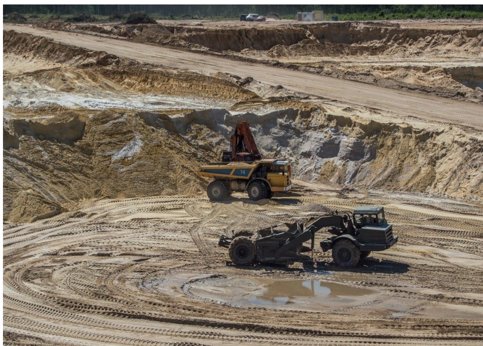
Рисунок 2 – Карьер «Лениндар»