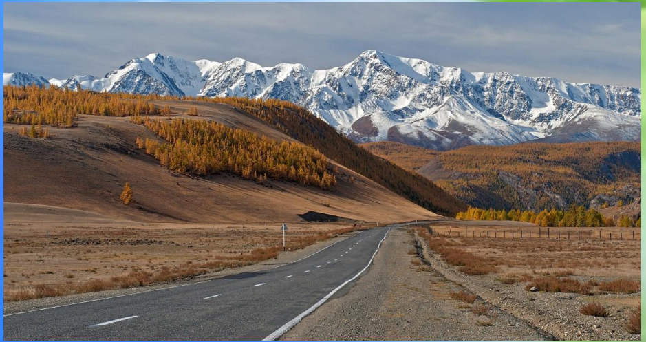
Чуйский тракт, Россия