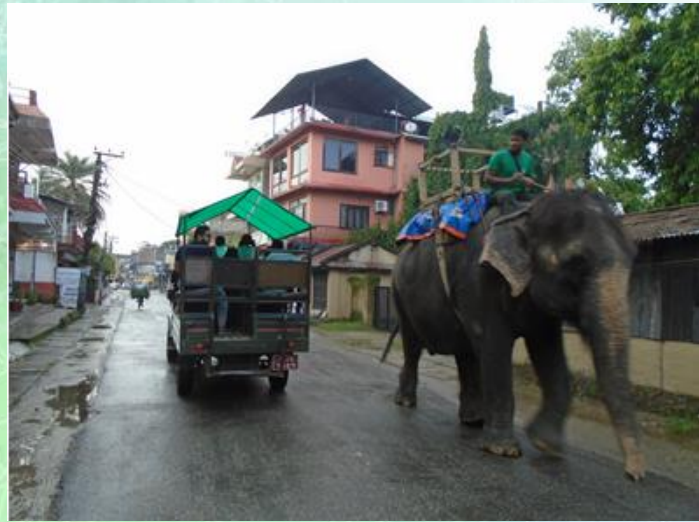
Деревня Саураха, Национальный парк Читван, Непал. Фото А.С. Соколова