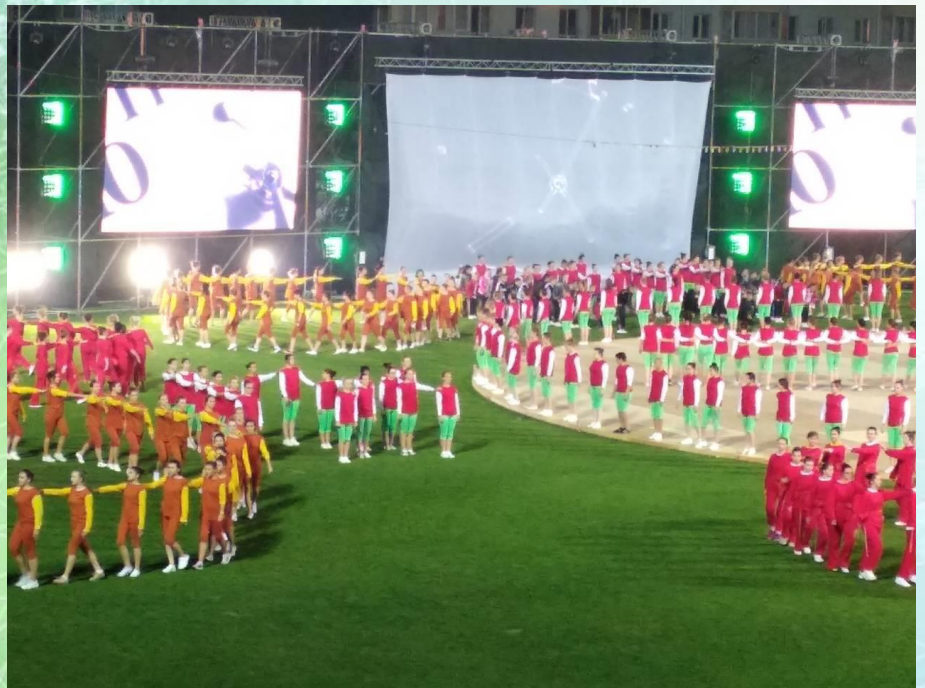
Выступление студенток группы ГЭ-31 на открытии фестиваля «Сожскі карагод»

29 сентября в 11.00 (ауд. 4-24) состоит день открытых дверей. Приглашаем всех заинтересованных. Абитуриенты смогут получить информацию о специальностях, по которым ведется подготовка, ознакомлены с учебной базой и лабораториями факультета.