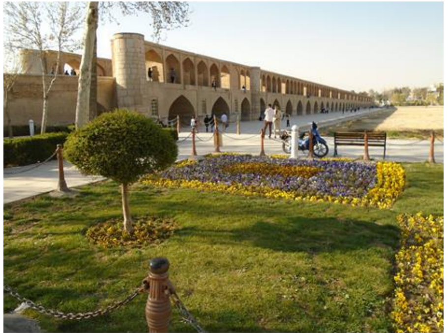
Мост через пересыхающую реку Зайендеруд, г. Исфахан, Иран

Подробная информация по адресу: https://conf.grsu.by/ape2018/ru/informatsionno-e-soobshchenie .