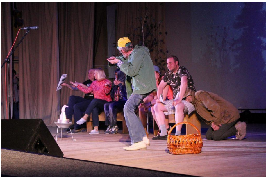
День факультета – 2018