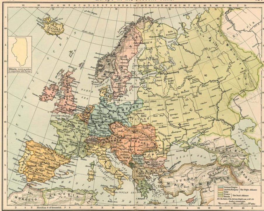
Карта Европы в 1911 году