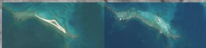
До и после урагана

Остров Ист, который входит в состав архипелага Гавайские острова, почти полностью ушел под воду после разрушительного урагана Валака. Ураган прошел еще в начале октября, однако данные об исчезновении острова ученые подтвердили только в конце месяца. Ураган относился к категории 4 по шкале потенциального ущерба, это соответствует значению «огромный». Специалисты ожидали, что Ист рано или поздно окажется под водой, однако полагали, что этот процесс займет несколько десятилетий. В реальности остров исчез практически за ночь. «Путь урагана не был результатом изменения климата, — сказал Чип Флетчер, — специалист по климату из Гавайского университета. — Однако его сила и время соответствуют эффектам от потепления океана и ростом глобальных температур, которые усиливают штормы». Площадь острова Ист составляла всего 4,45 гектара, основные материалы — песок и гравий. До 1952 года на нем была расположена радиолокационная станция береговой охраны США. Этот остров был важен как место гнездования гавайских зеленых морских черепах. Также на нем родилась часть популяции гавайских тюленей-монахов. Оба вида сейчас под угрозой исчезновения. Специалисты полагают, что большая часть животных в порядке, так как покинула остров до начала шторма. Климатологи не знают, выйдет ли Ист из-под воды снова. Даже если это произойдет, скорее всего, на восстановление погибших кораллов уйдет несколько лет.